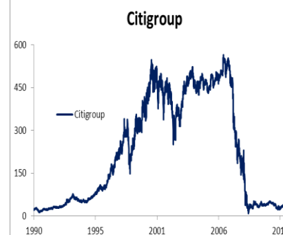
Tab. č. 1: Trhová hodnota akcií v portfóliu hedgeového fondu Paulson & Co.: